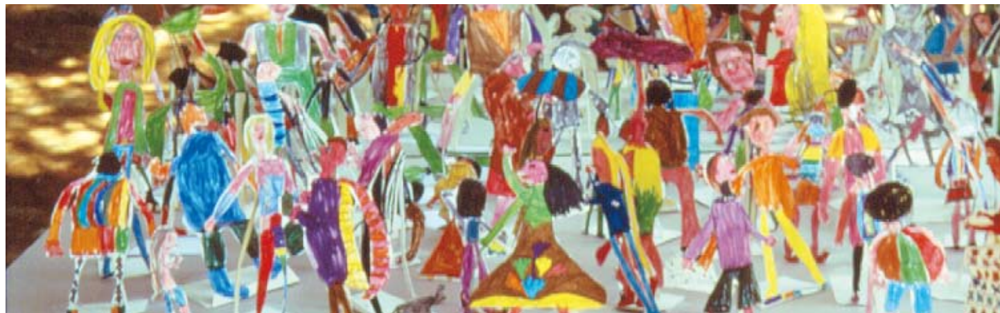
Folla in creta e folla grafica / Crowd in clay and crowd in drawings autori: bambini e bambine dai 5 ai 6 anni / authors: children aged 5-6 years

NEL 2012 CIRCA 70.000 PRESENZE AL CENTRO INTERNAZIONALE LORIS MALAGUZZI DA 53 PAESI: